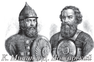
К. Минин и Д. Пожарский

ВСТАВАЙ, СТРАНА ОГРОМНАЯ, ВСТАВАЙ НА СМЕРТНЫЙ БОЙ. С ФАШИСТСКОЙ СИЛОЙ ТЕМНОЙ, С ПРОКЛЯТОЮ ОРДОЙ! В. ЛЕБЕДЕВ КУМАЧ И А. АЛЕКСАНДРОВ