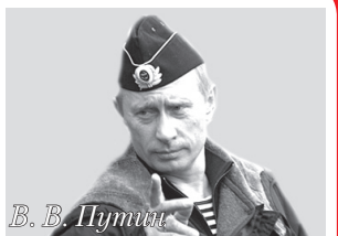
В. В. Путин

«Мы будем действовать последовательно, осмысленно и решительно. Устраняя фундаментальные причины коррупции и карая конкретных коррупционеров. Создавая мотивацию для тех людей, которые готовы служить России верой и правдой. Таких людей у нас в стране традиционно много. Они будут востребованы.»