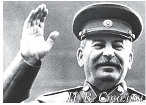
И. В. Сталин

Центральная Государственная Народная газета СССР. Сайт vladrus17.ru . Издаётся с 25 марта 2015 г.